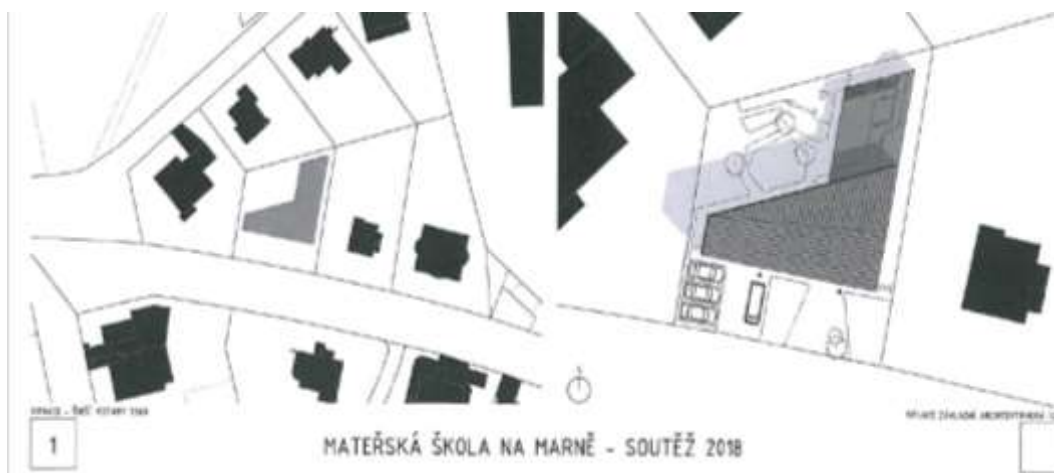
Obrázek č. 1: Část soutěžního návrhu navrhovatele – „situace širších vztahů“ a „koordinační architektonicko-urbanistická situace“