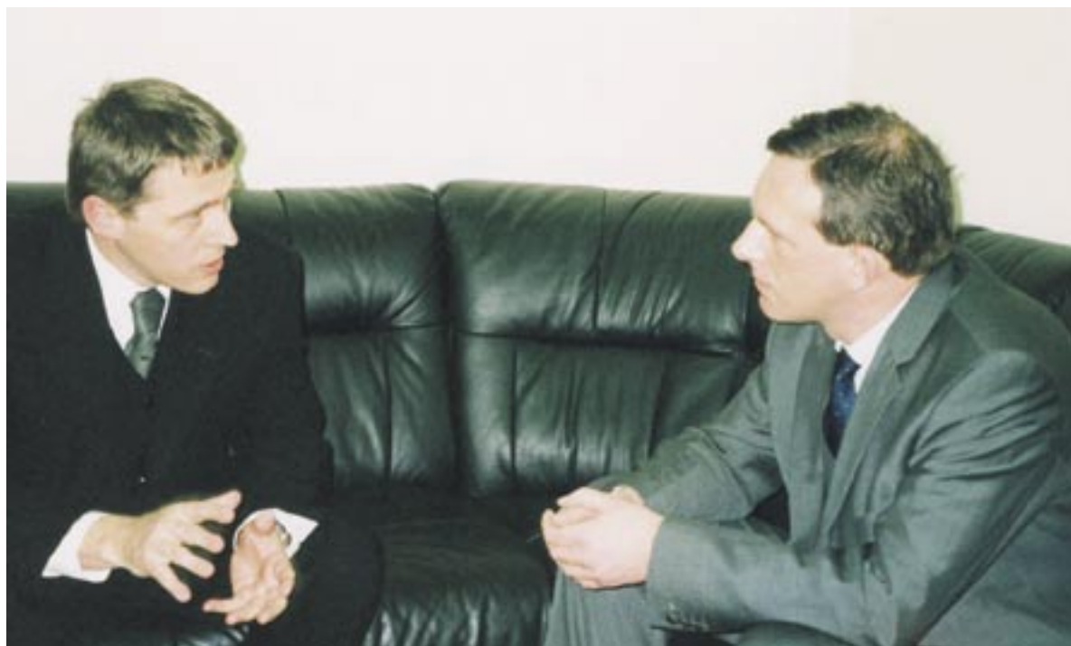
V lednu 2002 navštívil ÚOHS hlavní vyjednávač EU pro ČR Rutger Wissels (vpravo). Jedním z témat rozhovorů s předsedou Josefem Bednářem bylo i poskytování veřejné podpory v ocelářství.

V oblasti ocelářství Úřad pokračoval v plnění závazků vyplývajících pro Českou republiku z Evropské dohody a spolupracoval s Ministerstvem průmyslu a obchodu, které bylo zodpovědné za přípravu komplexního plánu restrukturalizace českého ocelářství. Tento restrukturalizační plán byl podmínkou Evropské komise pro prodloužení výjimky ze zákazu poskytování veřejné podpory do ocelářského průmyslu. Předložení tohoto restrukturalizačního programu, obsahujícího rovněž komplexní přehled poskytované veřejné podpory, umožnilo prodloužení této výjimky a odstranilo tak poslední překážku pro úspěšné uzavření vyjednávací kapitoly Hospodářská soutěž, ke kterému došlo 24. října 2002.