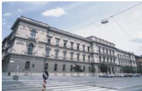
Sídlo Úřadu pro ochranu hospodářské soutěže.

o to, že jedinou přípustnou formou zajištění cestovních kanceláří proti úpadku je institut tzv. povinného smluvního pojištění a zákon nepřipouští jiné alternativní řešení. Tato skutečnost spolu s faktem, že pojišťovny ve své většině tento typ pojištění buď neposkytují, neboť jim zákon takovou možnost neukládá, nebo jen v případě sdružení se s jinými pojišťovnami v rámci tzv. poolu, má za následek, že na tomto trhu prakticky neexistuje konkurence a vzniká určitá asymetrie mezi nabídkou a poptávkou. Úřad tedy z vlastní iniciativy vypracoval návrh možné novelizace zákona č. 159/1999 Sb. Při přípravě tohoto návrhu se Úřad zaměřil na zabezpečení souladu právní úpravy s principy ochrany hospodářské soutěže a ochrany spotřebitele. Základním rozdílem oproti stávající právní úpravě je zavedení nového institutu povinných záruk pro případ úpadku cestovní kanceláře. Institut povinných záruk se pak dále dělí do dvou skupin. První skupinu představuje smluvní pojištění, které však oproti současnému právnímu stavu ztrácí svoji výlučnost. Právní úprava smluvního pojištění zůstává v zákoně jinak zachována beze změn. Druhou skupinu povinných záruk tvoří tzv. jiné záruky cestovních kanceláří pro případ úpadku, které mohou být poskytnuté bankou nebo jiným peněžním ústavem. Úřad také úspěšně uplatnil zásadní připomínku k občanskému zákoníku, která byla akceptována a do vládního návrhu zákona byla zpracována ustanovení, že postup pojistitelů nemůže být v rozporu s pravidly hospodářské soutěže.