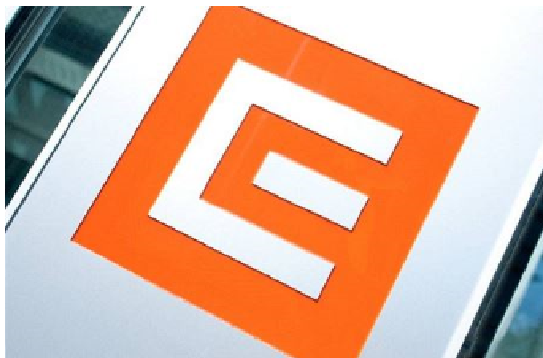
ČEZ - ILLUSTRACNÍ FOTO

PRAHA Energetická společnost ČEZ dostala pokutu 150 milionů korun za smlouvu se Sokolovskou uhelnou (SUAS) na dodávku uhlí pro elektrárnu Tisová. Specializovaný finanční úřad rozhodl, že ČEZ platí SUAS příliš málo a zneužívá svou sílu k cenovému diktátu. Verdikt je pravomocný, firma již pokutu zaplatila.